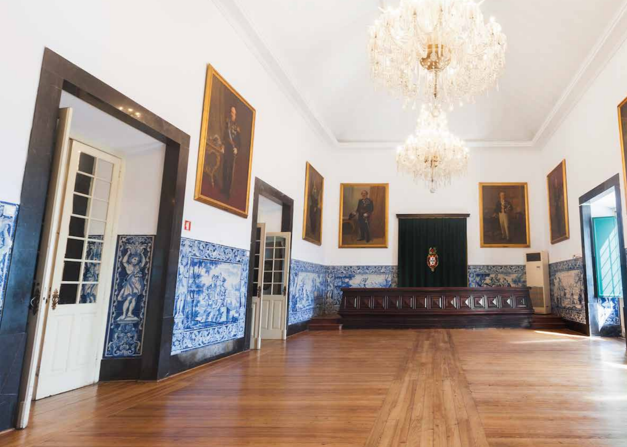
Sala do Conselho Supremo | Supreme Council Hall