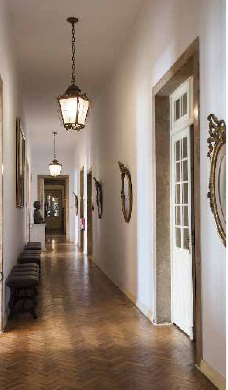
Palácio da Cruz Vermelha