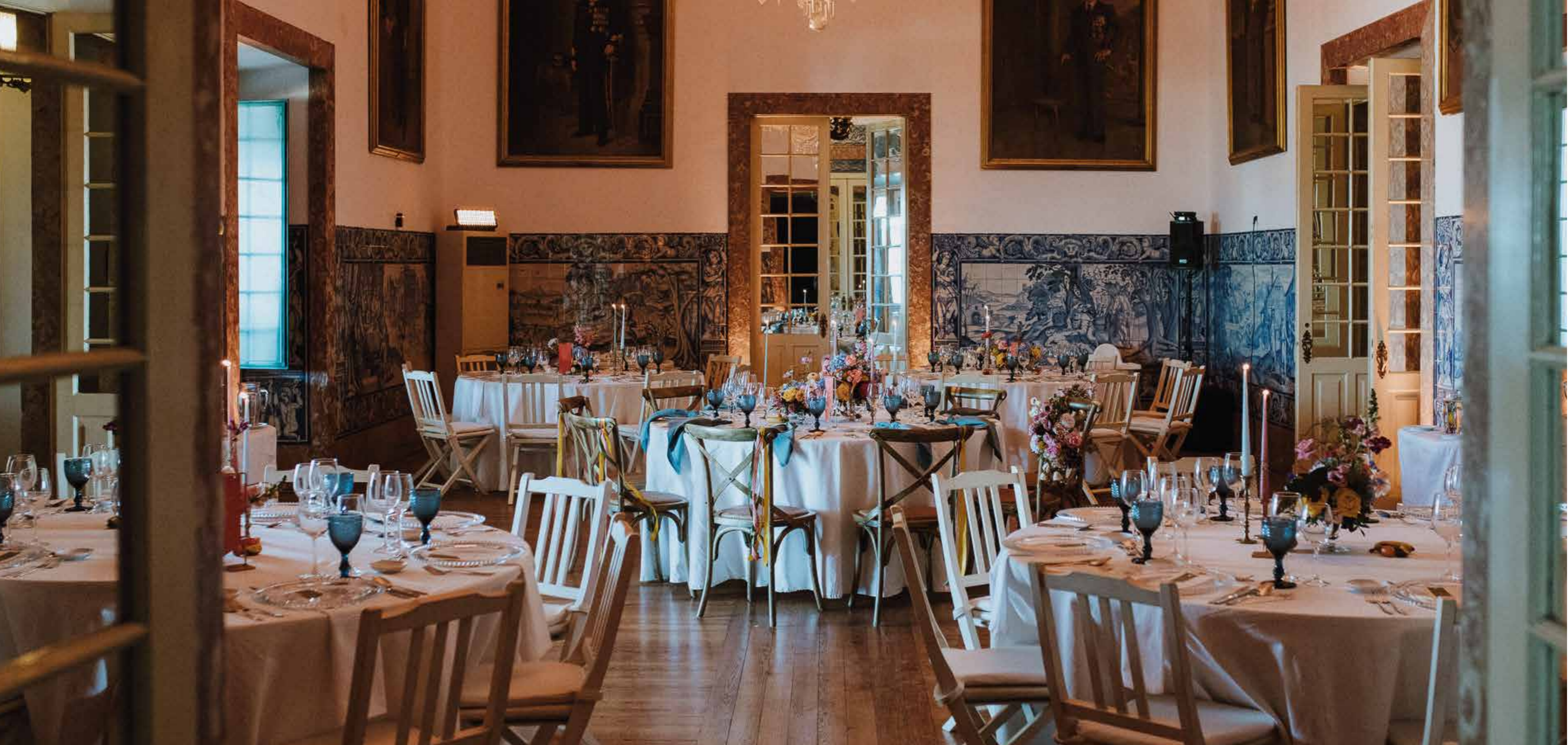
Sala das Parábolas | Parábolas Room