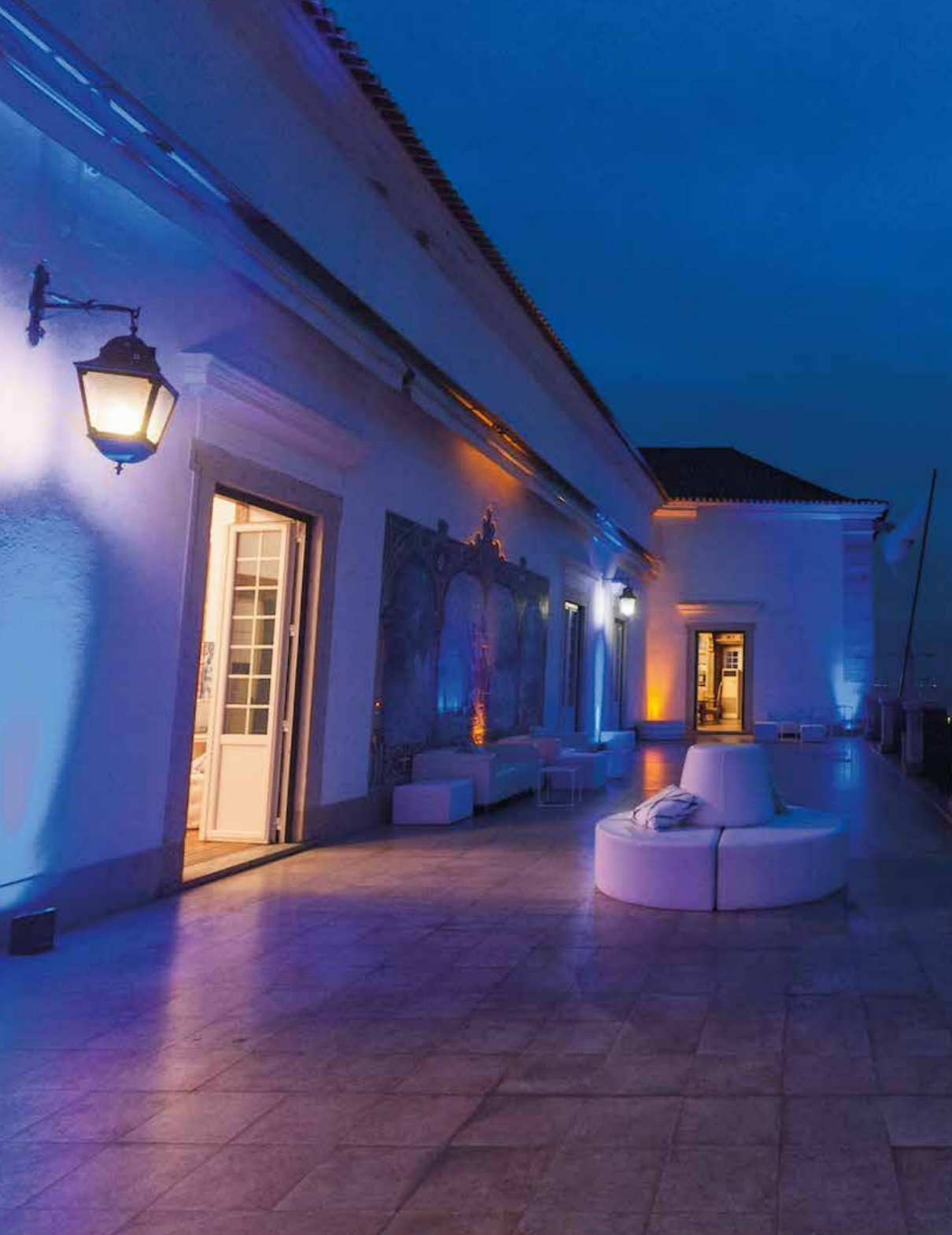
Terraço | Balcony